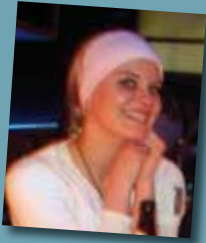
evelin der gute geist des hauses the good fairy