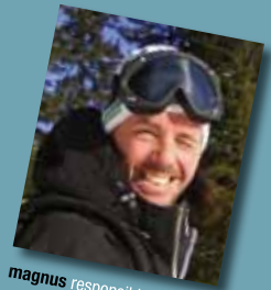
magnus responsible for everything + bar