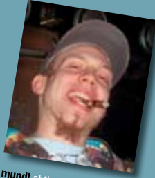
mundi at the door + partydancer