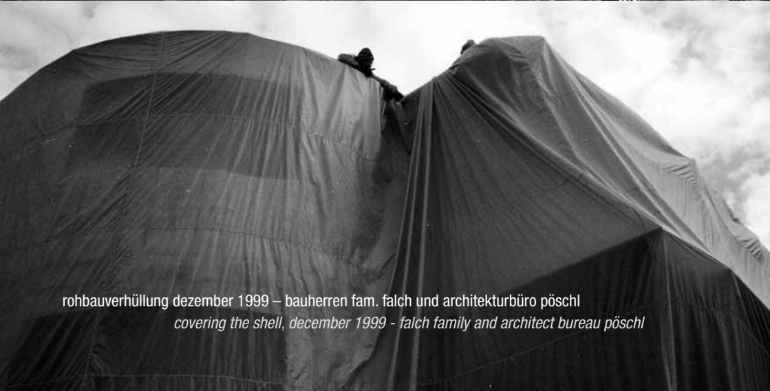
rohbaueverhüllung dezember 1999 – bauherren fam. falch und architekturbüro pöschl covering the shell, december 1999 - falch family and architect bureau pöschl