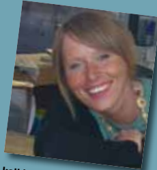
kathi vom square rom the square