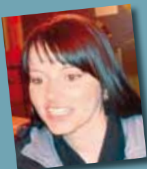
ines von der rezeption + service from the reception + service